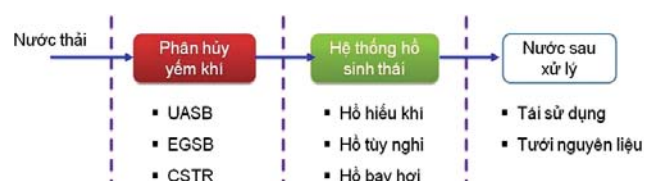
Hình 1. Các mô hình xử lý nước thải cồn sắn - ri đường phổ biến ở Thái Lan

Nhà máy sản xuất nhiên liệu sinh học Dung Quất có công suất thiết kế 100.000m 3 /năm, sử dụng nguyên liệu sắn lát. Hệ thống xử lý nước thải của Nhà máy do Liên danh Elcom và Yalian thiết kế (Hình 2), bố trí trên diện tích 1,2ha, công suất dòng thải trong điều kiện bình thường là 2.500m 3 /ngày đêm (nước bã rượu là 2.000m 3 /ngày đêm), sau khi xử lý đạt quy chuẩn QCVN 40:2011/ BTNMT cột B.