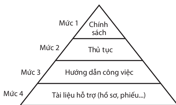
Hình 2. Khung cấu trúc của hệ thống quản lý ENSI Z10-2012

ISO 45001: Đề án xây dựng tiêu chuẩn này đã được Tổ chức Tiêu chuẩn hóa Quốc tế (International Organisation for Standardisation - ISO) phê duyệt vào tháng 10/2013, dự kiến ban hành vào tháng 10/2016 nhằm thay thế cho OHSAS 18001. Về cấu trúc và các nội dung cốt lõi, ISO